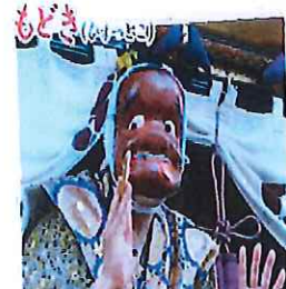
「もどき(ひょっとこ)」