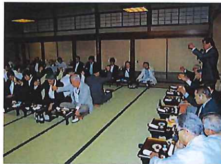
岩淵埼玉県計量協会会長 乾杯のご発声